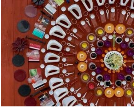
Ett av verken i tillfälliga utställningen ”Plastic witness” av Nina Romanus, 1 maj-31 juli.